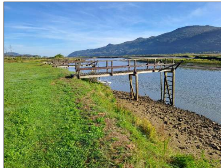
Imagen 5. Uno de los embarcaderos sobre la Ría en bajamar