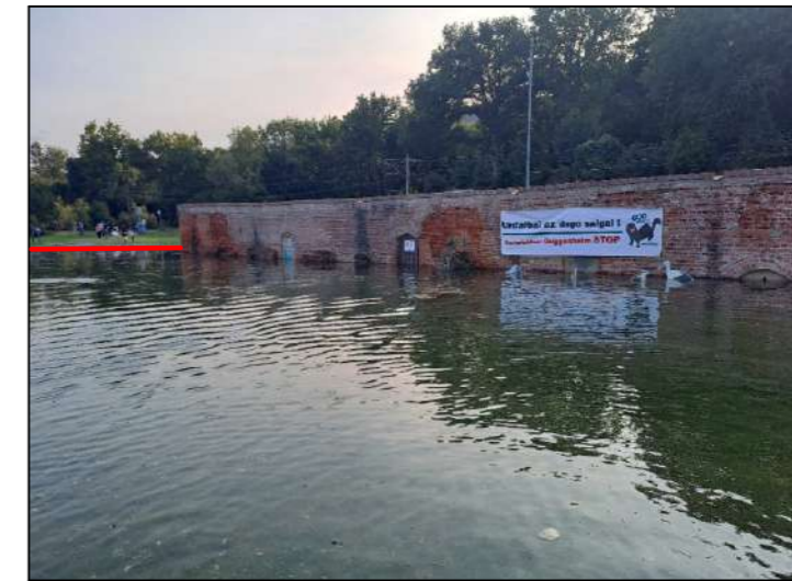
Imagen 12. Vista desde el noreste