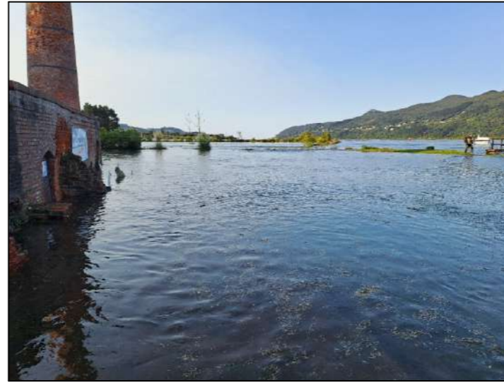
Imagen 8. Vista hacia el norte inundación La Tejera y parcela colindante hasta la Ría