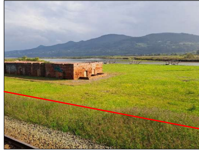
Imagen 2. Vista desde suroeste anterior a la pleamar