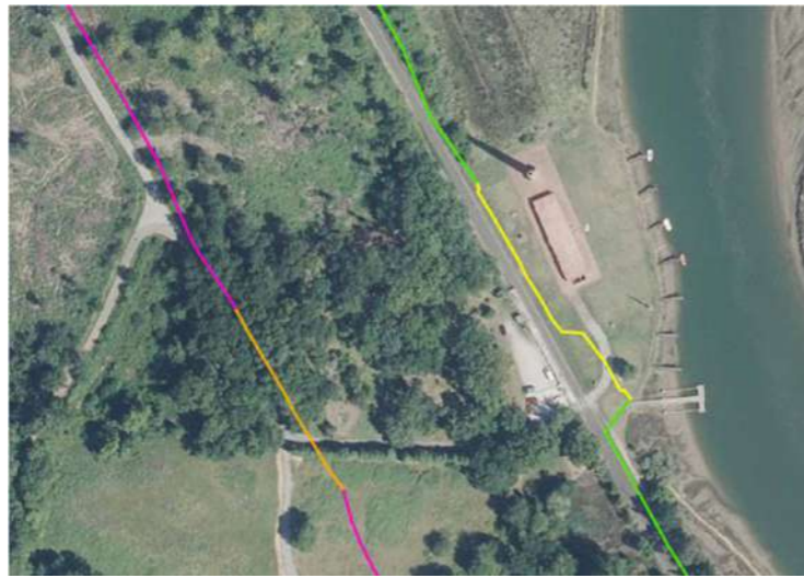
Imagen 1. Plano de situación.