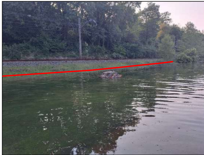
Imagen 10. Nivel alcanzado por la marea junto a las vías del tren