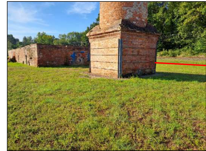
Imagen 3. Detalle chimenea y edificio desde noreste antes de la pleamar