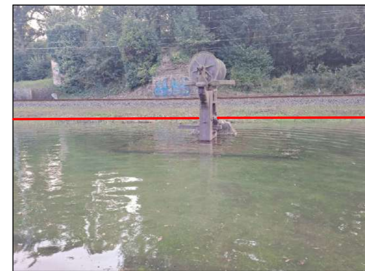
Imagen 6. Elemento imagen 4 en pleamar