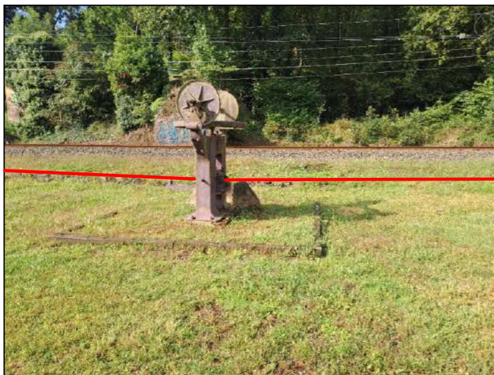
Imagen 4. Antiguo elemento junto a las vías del tren antes de la pleamar