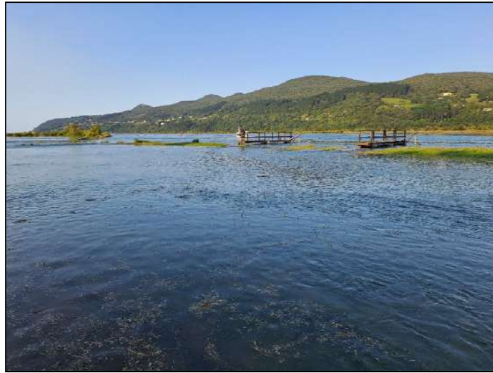
Imagen 7. Nivel del agua zona embarcaderos en pleamar